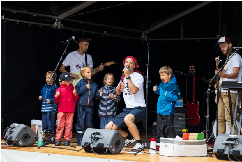
Mättu & Schnuder Buebe